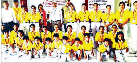
महेन्द्रगढ़। बच्चों को सम्मानित करते हुए।