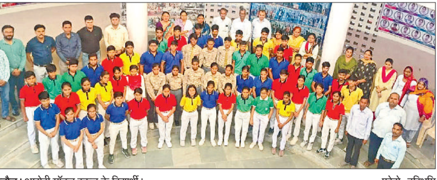
नारनौल। आरोही मॉडल स्कूल के विद्यार्थी।