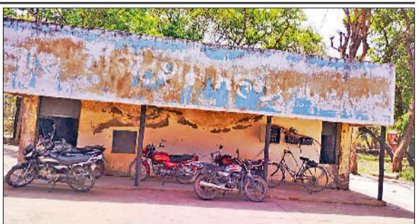
महेन्द्रगढ़। जनस्वास्थ्य कार्यालय।

रखते हुए वे नागरिकों को शुद्ध व पर्याप्त पेयजल उपलब्ध करवाना सुनिश्चित करें व सौकरेज की नियमित अंतराल पर सफाई करवाएं।