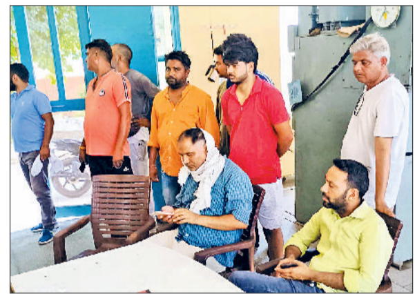
नारनौल। पावर हाउस में मौजूद ग्रामीण।