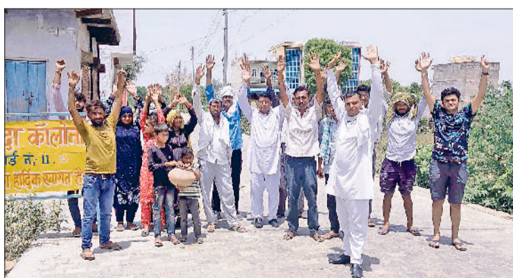
नांगल चौधरी। सरकार विरोधी नारेबाजी करते पेयजल संकट से परेशान शहरवासी।

आपूर्ति के लिए शहर में वाटर टैंकों का निर्माण कराया गया है। प्रत्येक बुस्टर पर कर्मचारी तैनात हैं, ताकि लोगों को नियमित रूप से पानी मिल सके, लेकिन शहर के वार्ड