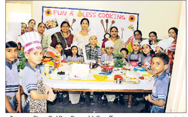
महेन्द्रगढ़। कुकिंग प्रतियोगिता हिस्सा लेते विद्यार्थी।