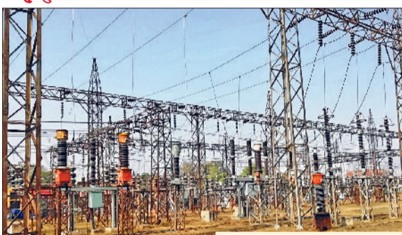
नारनौल। पॉवर हाउस।

भीषण गर्मी की तपिश बढ़ने के साथ ही बिजली की मांग बढ़ गई है। लोगों के घरों एवं दफ्तरों के साथ-साथ अन्य स्थानों पर भी कूलर, पंखा और एसी चलने से बिजली की मांग में बढ़ गई है। बीती 12 मई को जहां समूचे नारनौल सर्कल यानि जिला महेन्द्रगढ़ में बिजली खपत एक दिन में जहां 35.33 लाख यूनिट थी, वहीं 20 मई को यह बढ़कर 54.35 लाख यूनिट दर्ज की गई। उल्लेखनीय है कि क्षेत्र में इन दिनों लोगों को झुलसाने वाली गर्मी परेशान कर रही है। सूरज सवेरे से ही अपने कड़े तेवर दिखा रहा है। दिन में जहां सूर्यदेव की किरणें आग उगलती रहती हैं, वहीं रात को भी भारी गर्मी एवं उमस बनी रहने से लोगों का बुरा हाल रहता है। लोग इससे बचने के लिए दिन-रात कूलर, पंखे एवं एयर कंडीशनर को चलाए रखने को मजबूर हो रहे हैं। गुरुवार को दिन भर आसमान साफ रहने व तेज धूप निकलने से लोगों का हाल बेहाल रहा। शाम व रात के समय भी लोग पसीने से तरबतर दिखे। दिन का तापमान 45 डिग्री पार चल रहा है और लोग आवश्यक कार्यों से ही