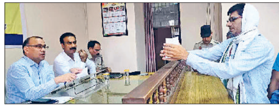
महेन्द्रगढ़। लोगों की शिकायत सुनते हुए।

उपायुक्त डॉ. विवेक भारती ने वीरवार को लघु सचिवालय परिसर में आयोजित समाधान शिविर में आई 50 शिकायतों की सुनवाई की। इस दौरान उन्होंने संबंधित विभागों के अधिकारियों को निर्देश देते हुए कहा कि इन शिकायतों का यथाशीघ्र निपटारा सुनिश्चित किया जाए। उन्होंने समाधान शिविरों की लंबित शिकायतों की समीक्षा करते हुए संबंधित अधिकारियों को लंबित